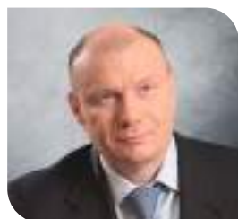
Потанин Владимир Олегович